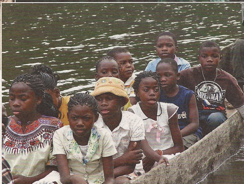
Az Afrikáért Alapítvány árvái a Bonobo Rezervátum táván csónakáznak

Amikor Afrikába indultam október elején, a legtöbben azzal eresztettek utamra: egy cuki fekete babát örökbe fogadhatnak. Volt, aki hozzátette: ott úgy sincs esélye normális életre. Sok gyönyörű afrikai gyerek van, kétségtelenül, de vajon az a legjobb módja a segítségnek, ha fehér emberek Európába hozzák őket? Nem biztos. De az igen, hogy kitűnő üzlet afrikai gyerekekkel „kereskedni”.