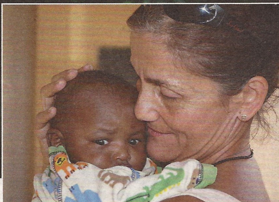
A TAITA Alapítvány Kenyában fenntartott árvaházának legfiatalabb lakóját pár naponapán tették egy templom lépcsőjére